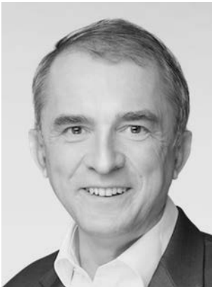
Tullner, Marco CDU Minister für Bildung, Historiker, MdL 06110 Halle (Saale) *1968 in Wismar Wahlkreis 36 (Halle II)