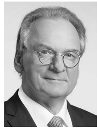
Dr. Haseloff, Reiner CDU Ministerpräsident des Landes Sachsen- Anhalt, MdL; 06866 Lutherstadt Wittenberg *1954 in Bülzig Wahlkreis 24 (Wittenberg)