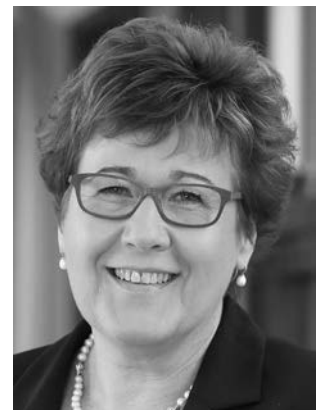
Grimm-Benne, Petra SPD Ministerin für Arbeit, Soziales und Integration des Landes Sachsen-Anhalt 39218 Schönebeck (Elbe) *1962 in Wuppertal; Landesliste