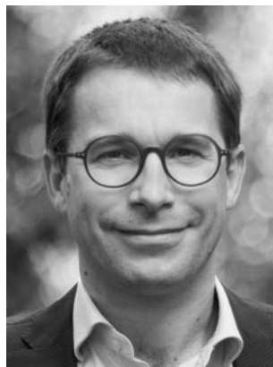
Striegel, Sebastian BÜNDNIS 90/DIE GRÜNEN Politikwissenschaftler, MdL 06108 Halle (Saale) *1981 in Halle (Saale); Landesliste