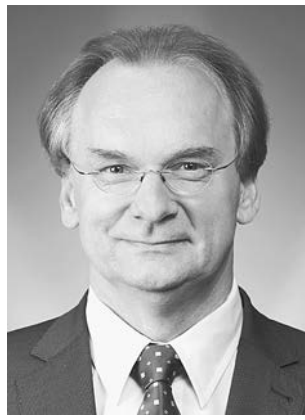
Haseloff, Dr. Reiner CDU Diplomphysiker; 06886 Lutherstadt * 1954 in Bülzig bei Wittenberg Wahlkreis 27 (Dessau-Roßlau-Wittenberg)