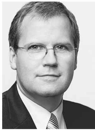
Bullerjahn, Jens SPD Minister, Elektroingenieur; 06313 Ahlsdorf * 1962 in Halle Wahlkreis 33 (Eisleben)