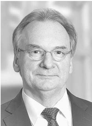
Dr. Haseloff, Reiner CDU Diplom-Physiker, Ministerpräsident 06886 Lutherstadt Wittenberg *1954 in Bülzig Wahlkreis 27 (Dessau-Roßlau-Wittenberg)